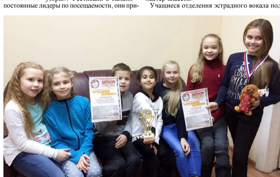
Вокальный ансамбль «Колибри».

вивают любовь к искусству тысячам детей.